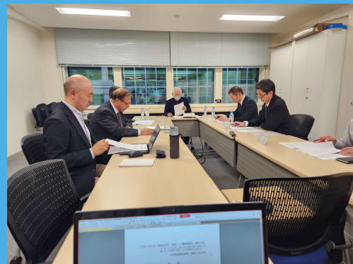
【第80回地域ルール運営委員会開催風景】