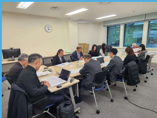
【第84回地域ルール運営委員会開催風景】